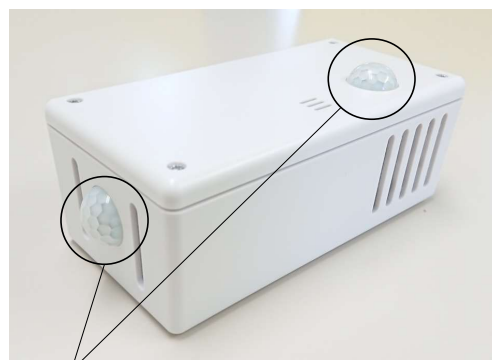
人感センサー（球状のもの）は上面と縦側面に装備