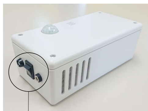
電源スイッチ、電源LED、ACアダプター差込口 電源オン時はLEDランプが緑色に点灯